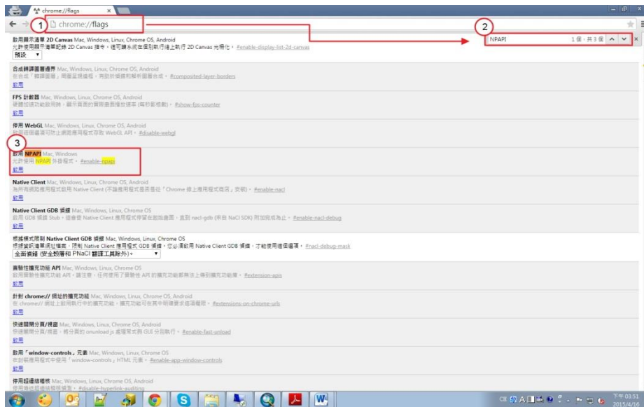
圖 2. 開啟 Chrome://flags 並找到 NPAPI 設定